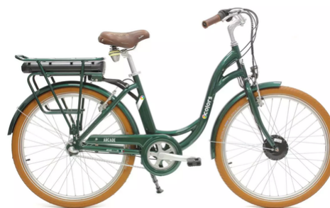
VAE Arcade E-Colors

21 vitesses | Cadre aluminium | Roue 28 pouces | Pneus anti crevaison | Suspension avant