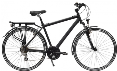
VTC Arcade Escape

21 vitesses | Cadre aluminium | Roue 28 pouces | Pneus anti crevaison | Suspension avant